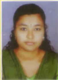
ലീന. ടി. എസ്