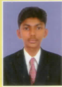
സംഗീത്. എസ്. പി