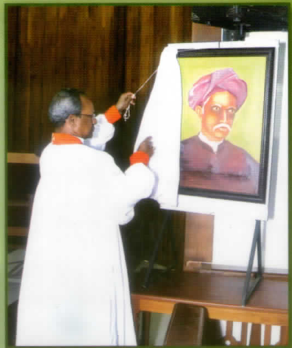
മോശവൽസലം ശാസ്ത്രിയാർ ചിത്രം അനാമരാനം