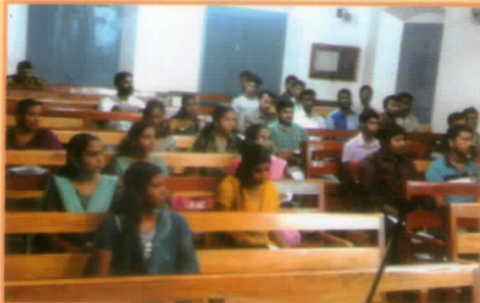
യുവജനസംഘടനയുടെ നേതൃത്വത്തിൽ നടന്നുവരുന്ന കരിയർ ട്രൈഡൻസ് പ്രോഗ്രാം