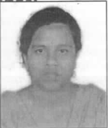
സത്യദൈ. ജി. എസ്