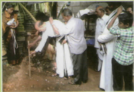
കാട്ടാക്കട എല്ലാ സീ.ഇ.വൈ.എഫ് ക്രിക്കറ്റ് ഛത്തരവിയെകൾ