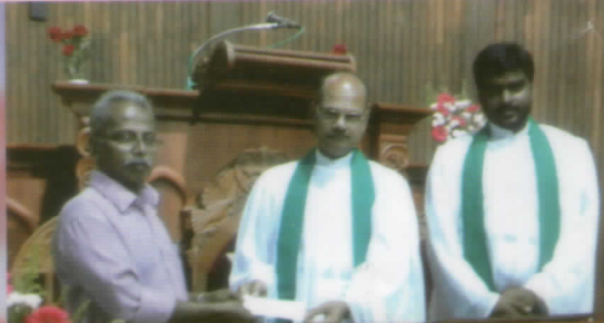
പുവർ ഫണ്ട് മാസാചരണം കവർ കളക്ഷൻ ഉദ്ഘാടനം