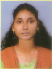
ഷിബിദാസ്. സി.സി ക്ലൈസ്റ്റ് കോളേജ് ഇക്കണോമിക്സിൽ SET ലഭിച്ചു