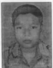
എബിൻ ബി എസ്

ഹാഡ് തമ്മുശു മീട്ടാം നാദത്തോടെ ഹാഡ് കൊട്ടിപ്പാടാം തപ്പെല്ലാം കൊട്ടിപ്പാടാം ഹാഡ് മീട്ടിടാം വീണവെങ്ങും മീട്ടിടാം ഈ ക്രിസ്തു രാജൻ സന്നിധിയിൽ