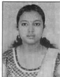
സുമി ഇ ബി