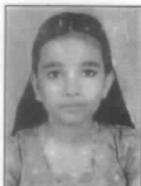
പുല്ല ആർ ആൻസലം

ഭൃഗുകളാം ഞങ്ങൾ തൻ വഴിയിൽ നല്ലിടയനായ് നിത്യവും നടത്തണമ ഭയമതുമില്ലാതെ ജീവിക്കാൻ ഞങ്ങളെ നയിക്കുണമ