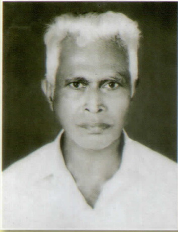
വെണുവിൽ വീച്ചർ ലീലാകോട്ടേജ്